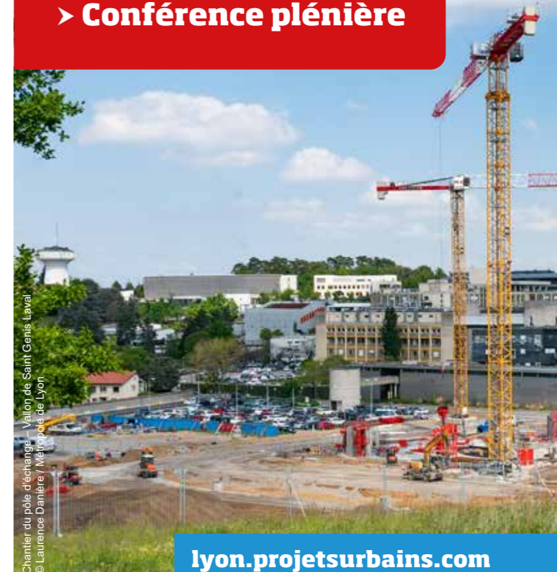
Chantier du pôle d'échange - Valon de Saint Genis Laval