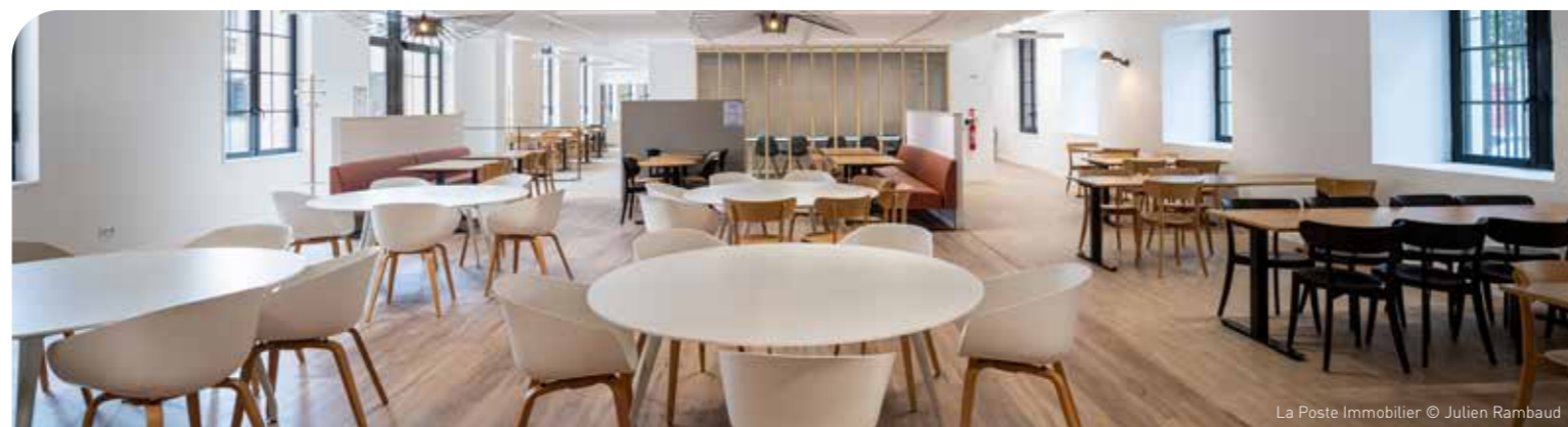
La Poste Immobilier