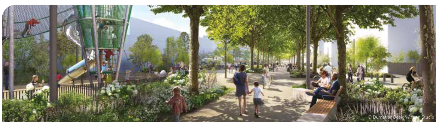
© Dumétier Design / Yarn Studio